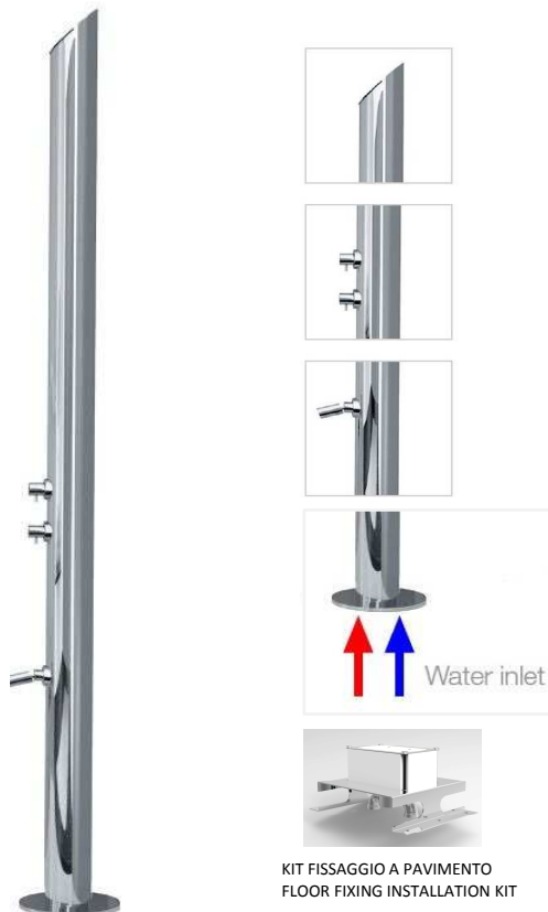
Immagine Prodotto - Product Image

Душевая колонна AquaBambù для установки вне помещения, из стали INOX AISI 316 - Комплект душевой колонны состоит из: Комплект для крепления к полу и подключению к водоснабжению (горячему и холодному) - 2 прогрессивных смесителя - Диффузор с каскадным изливом - аэрированный излив для ног