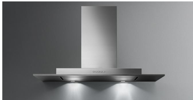
Immagine indicativa del prodotto Potrebbe non corrispondere alla versione selezionata