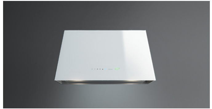
Immagine indicativa del prodotto Potrebbe non corrispondere alla versione selezionata